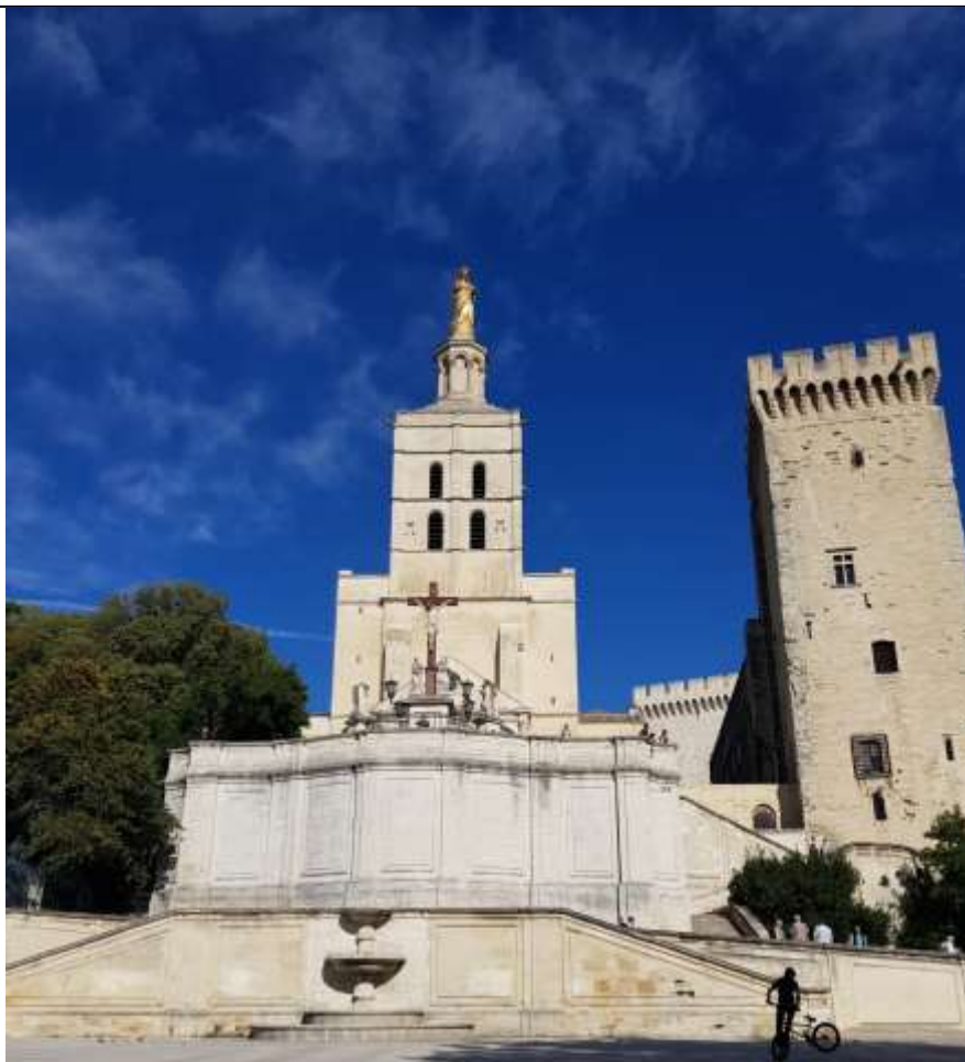
Impressionen aus Avignon/ Provence